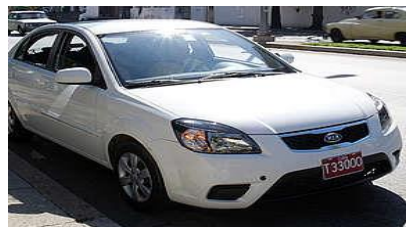
medio - middelgrote auto

airconditioning & radio voor 3 - 4 personen 2 grote & 2 kleine koffers bijv: Skoda Fabia Sedan